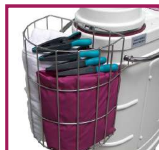
1 panier de rangement