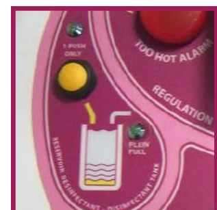
1 système d'injection automatique de BFR4.0 par pompe péristaltique