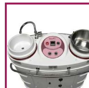
1 kit de toilette avec un robinet lave-mains