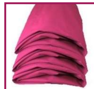
2 protections 120 X 200 cm