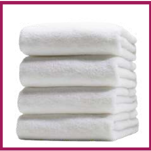
1 drap de bain 158 X 200 cm