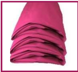
1 protection 120 X 200 cm