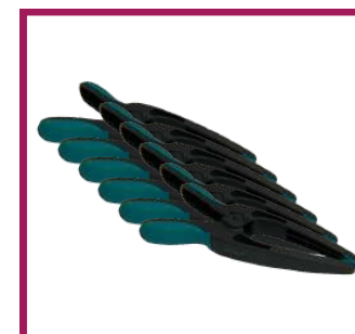
6 pinces de préhension