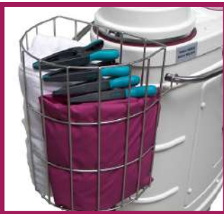
1 panier de rangement