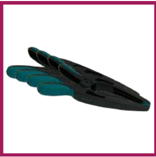
4 pinces de préhension