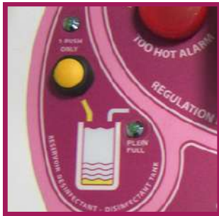
1 système d'injection automatique de BFR 4.0 par pompe péristaltique