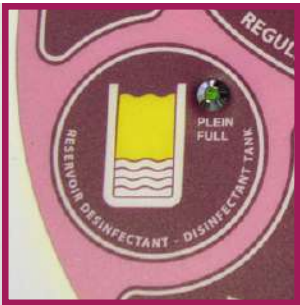
1 double système de désinfection thermique et chimique intégré