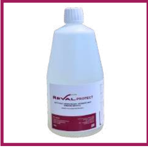
1 bidon de 1L Reval Protect