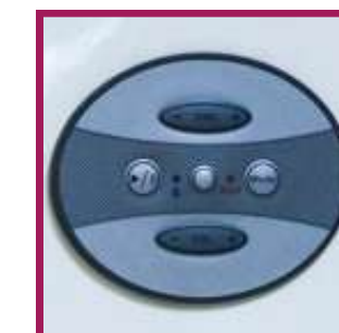
1 option musicothérapie par dispositif bluetooth