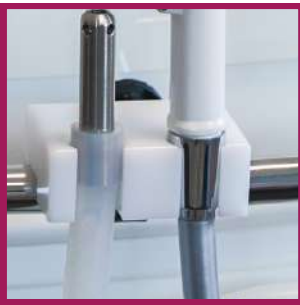
1 support douchette et buse d'aspiration