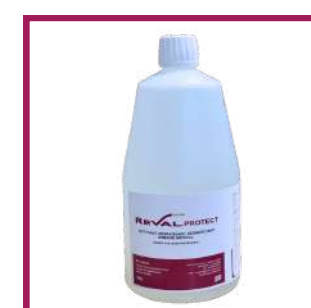
1 bidon de 1L Reval Protect