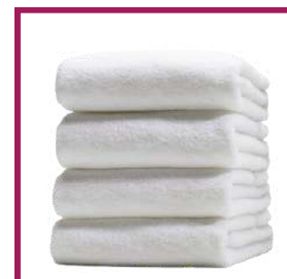
2 draps de bain 158 X 200 cm