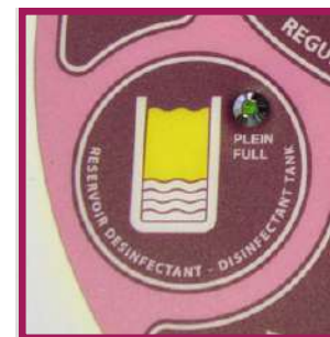
1 double système de désinfection thermique et chimique intégré