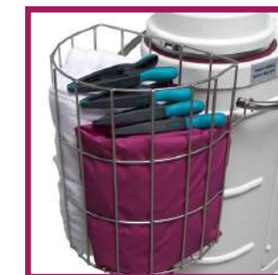
1 panier de rangement