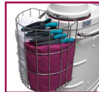
1 panier de rangement