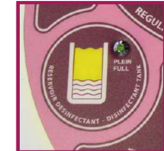
1 double système de désinfection thermique et chimique intégré