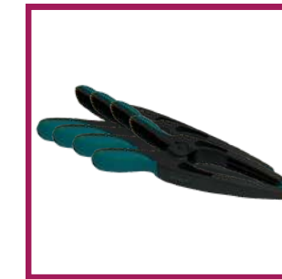
4 pinces de préhension