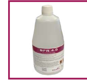
1 bidon de 1 L BFR 4.0