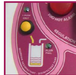
1 système d'injection automatique de BFR4.0 par pompe péristaltique