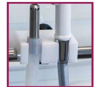
1 support douchette et buse d'aspiration