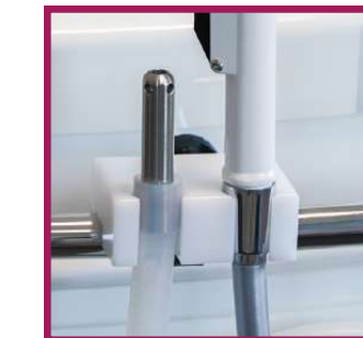
1 support douchette et buse d'aspiration