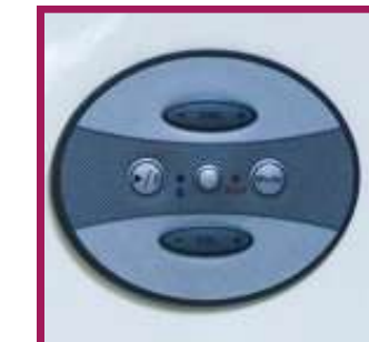
1 option musicothérapie par dispositif bluetooth