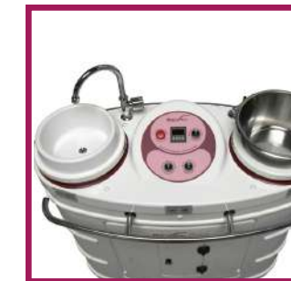
1 kit de toilette avec un robinet lave-mains