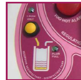
1 système d'injection automatique de BFR 4.0 par pompe péristaltique