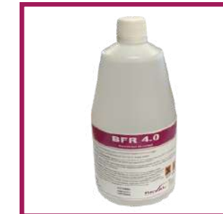
1 bidon de 1 L BFR 4.0