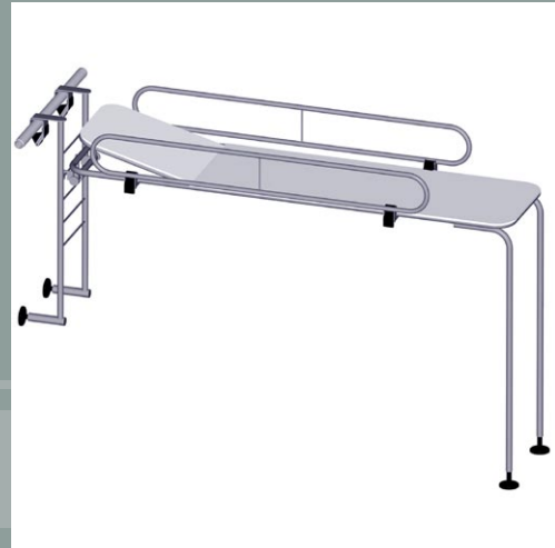
Table de massage immergeable