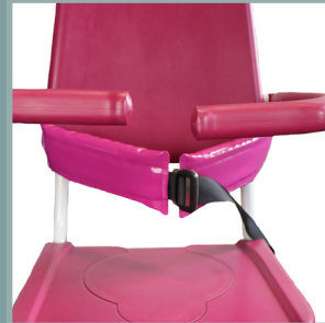
Jeu de 2 protections étanches pour ceinture de maintien.