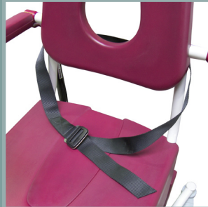
Ceinture de maintien abdominale.