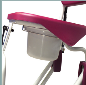
Seau avec rails de guidage.