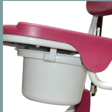
Option seau réf. 5600.10