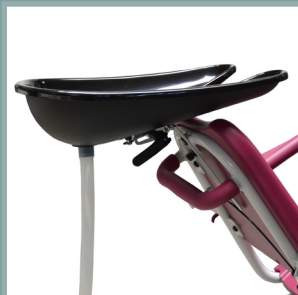
Bac à shampooing réglable et amovible.