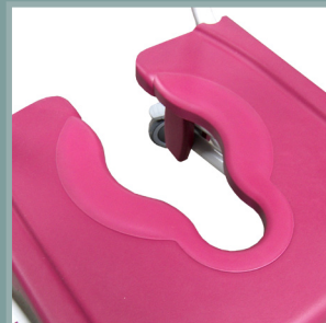
Bouchon d'assise adaptif.