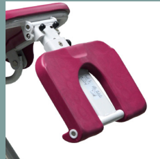
Option repose-jambes réglable