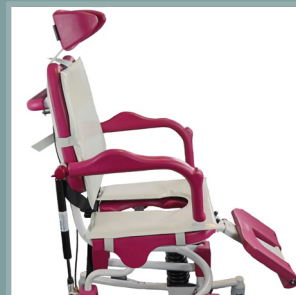
Ensemble coussin d'assise + dossier.