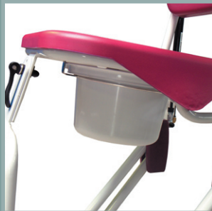
Seau avec rails de guidage.