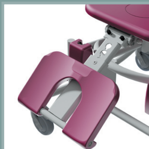
Option repose-jambes réglable.