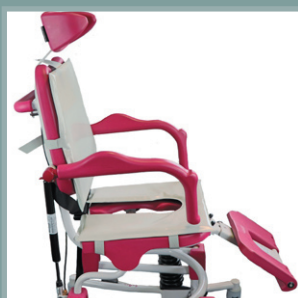
Ensemble coussin d'assise + dossier.