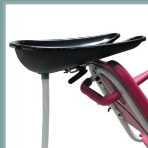
Bac à shampooing réglable et amovible.