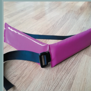
Jeu de 2 protections étanches pour ceinture de maintien.