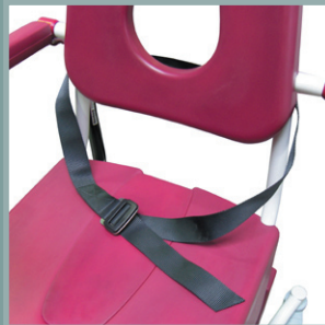
Ceinture de maintien abdominale.