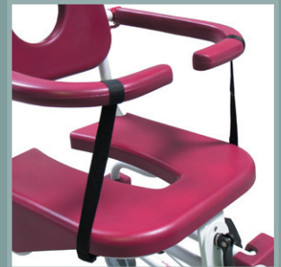
Sangles de maintien pour patients agités.