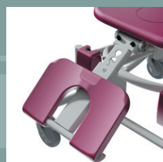
Option repose-jambes 5600.50