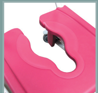
Bouchon d'assise adaptif.