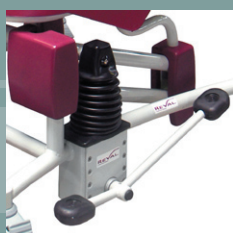
Pédale de levage hydraulique