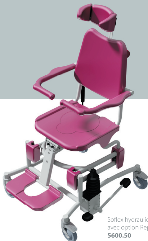
Soflex hydraulique 5601.00 avec option Repose-jambes 5600.50

Transfert des patients, accès aux toilettes ou à la douche, soins corporels, en toute sécurité grâce à un équipement polyvalent et confortable.