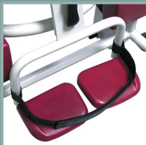
Sangles de maintien des pieds du patient.