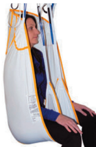
Sangle série 5467.8*