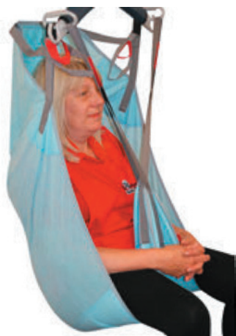
Sangle série 5467.7*

Pour une hygiène stricte, les sangles séries 5467.7* et 5467.8* sont prévues pour une utilisation avec un patient unique. Les sangles de la série 5467.7* sont des sangles jetables n'autorisant aucun lavage. Les sangles de la série 5467.8* sont des sangles à usage limité autorisant jusqu'à 20 lavages successifs au maximum.