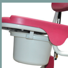
Option seau réf. 5600.10