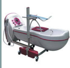
Illustrations: Topaz réf. 5462.00 + baignoire Cocoon TS